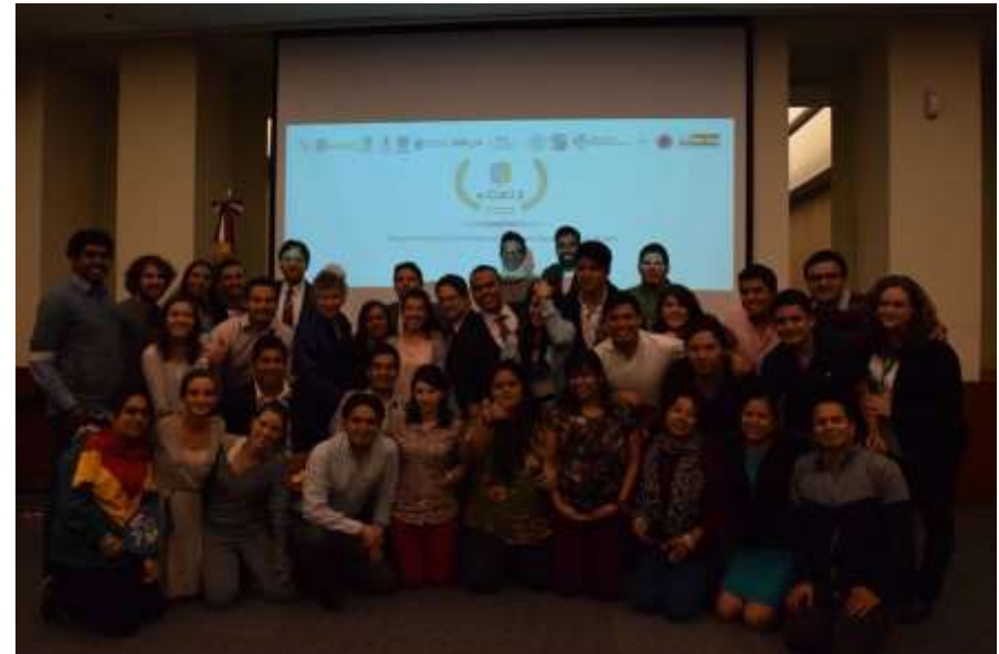
Mexico City June 2015 Ministry of Foreign Affairs of Mexico