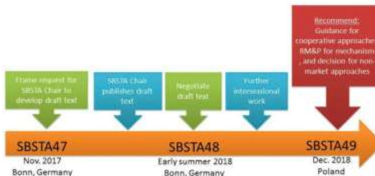
Informal work plan prepared by the co-facilitators of the SBSTA session relating to Article 6 of the Paris Agreement