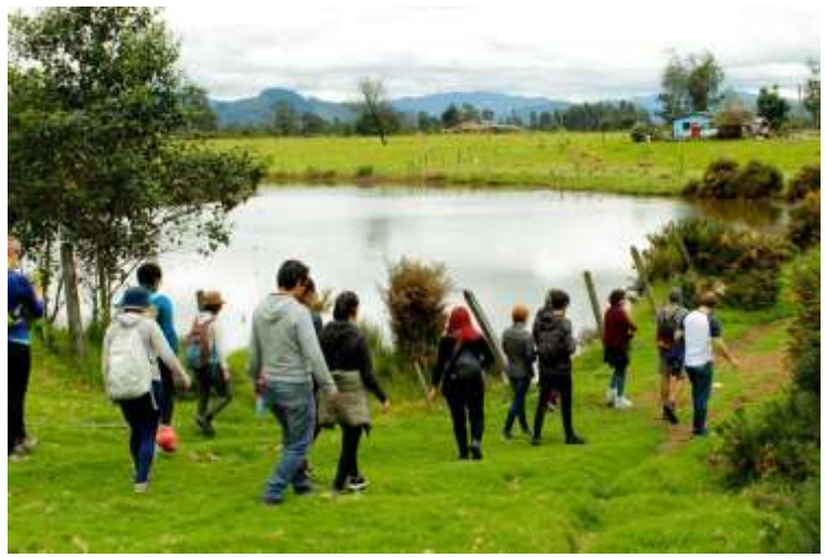
Movimiento de jóvenes Latinoamericanos y Caribeños Frente al Cambio Climático