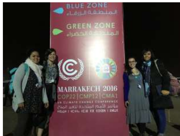
Movimiento de jóvenes Latinoamericanos y Caribeños Frente al Cambio Climático