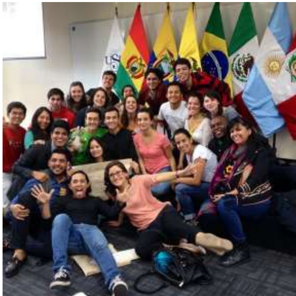
Lima, Perú December 2014 Universidad San Ignacio de Loyola COP 20